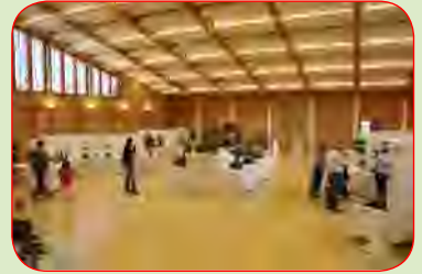
Regio Bonsai Show 2008

2008 war es dann soweit, die Regio Bonsai Show wurde erstmals mit grossem Erfolg im Kultur & Sport Zentrum (KSZ) in Pratteln durchgeführt. Die über 300 begeisterten Besu-